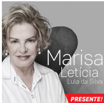
Marisa Letícia Lula da Silva